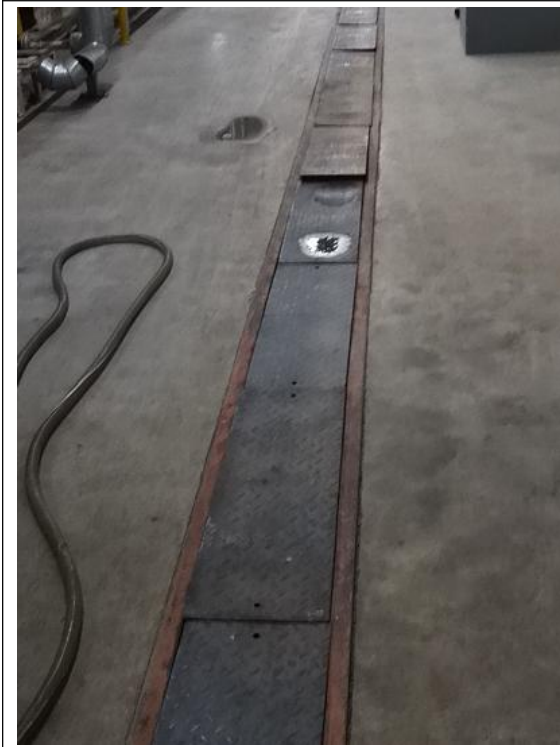
图 8 平板车间地面导流沟