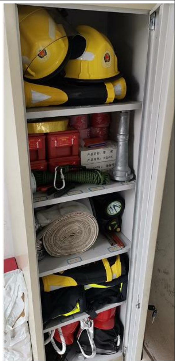
图 11 微型消防站