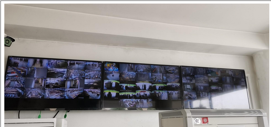
图 4 视频监控系统