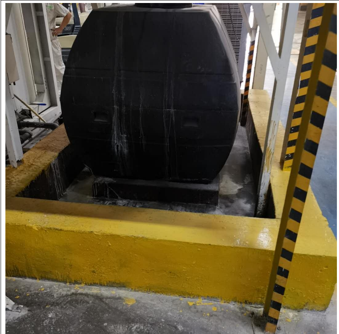
图 5 碱液存储罐