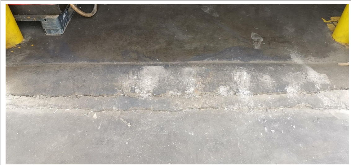
图 2 油库出口缓坡