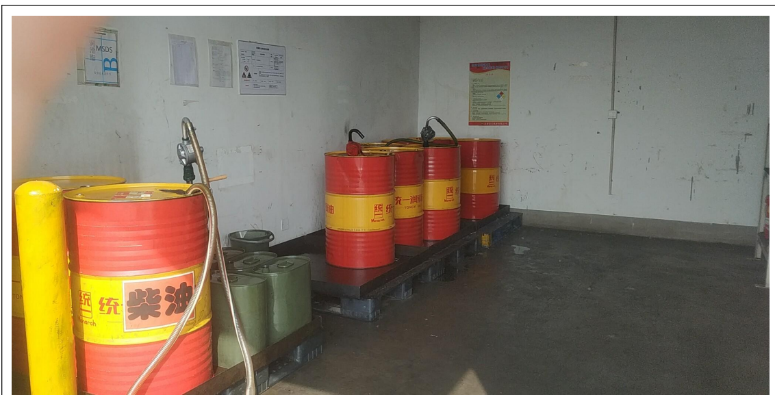
图 1 油库照片