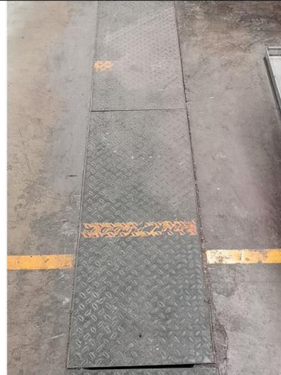
图 9 印刷车间地面导流沟