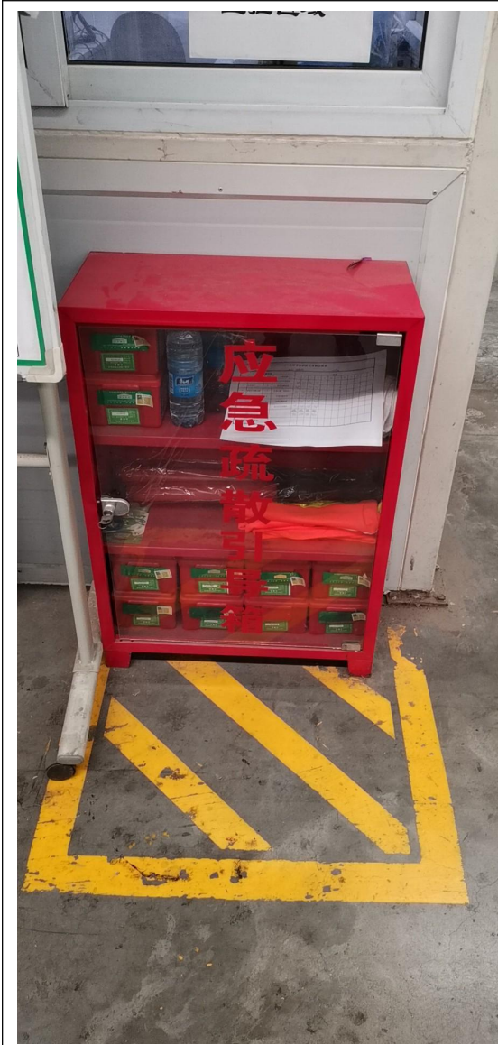
图 10 疏散引导箱