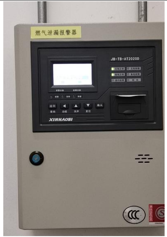
图 7 可燃气体报警器