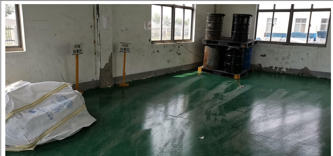
图 3 危险废物暂存间